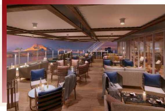
Sky Bar (Deck 9)