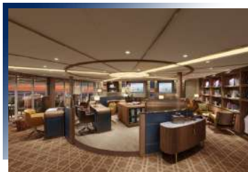
Seabourn Square (Deck 6)

船上配有4個露天溫水按摩浴池與1個露天無邊際泳池，這個戶外區域舒適且有利於放鬆，四周環境融入了大海和地平線，觸目所及皆是極地壯麗的風景。