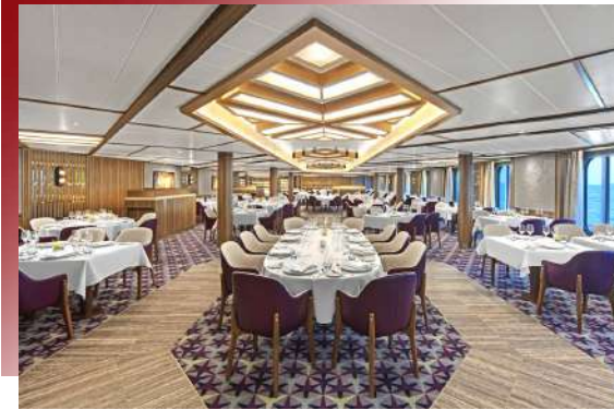
The Restaurant (Deck 4)