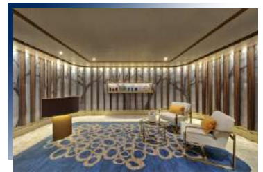
SPA &amp; Wellness &amp; Fitness Center (Deck 7)

多功能全方位的交誼廳，這裡有服務台，咖啡吧，專業的咖啡師提供香醇現煮咖啡，全天供應糕點、三明治、冰淇淋等，這裡也有圖書館與資訊中心。