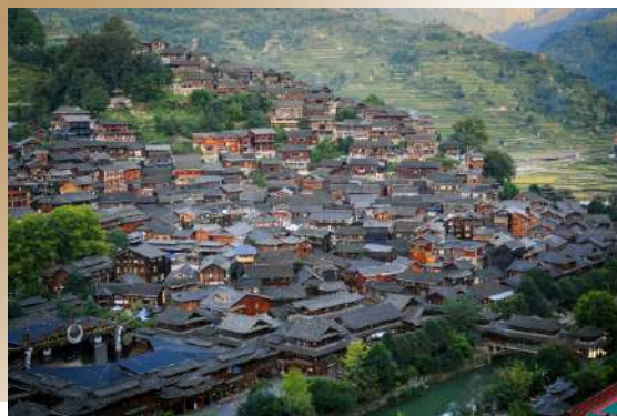
千盞燈火綴腳樓，烏江星落水中央 無人機飛繪夜空，梯田水幕舞霓裳

白水穿寨流銀鍊，風雨橋畔歲月長 銀飾叮咚隨舞起，蘆笙聲裡藏時光 青石板上踏故事，蠟染布中繡滄桑 美人靠邊聽風語，吊腳樓角掛斜陽