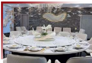
白孔雀脆皮燒鵝餐廳是百年滋味旗下的粵菜餐廳