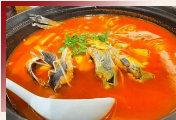
以野生小番茄為主料，混合米湯發酵，色澤紅亮 貴州非遺美食-酸湯魚

貴州酸湯魚以「自然發酵酸湯+現殺活魚+木薑子提香」定義風味天花板。酸湯技藝入選省級非物質文化遺產，獲「中華餐飲名店」認證，寫入《北京釣魚臺國宴菜譜》。