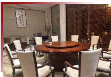
於2024年獲評「國家五鑽級酒家」餐飲最高榮譽

脆皮燒鵝：採用傳統工藝製作，外皮酥脆如薯片，肉質鮮嫩多汁。推薦搭配秘制梅子醬或酸辣醬，解膩增香。