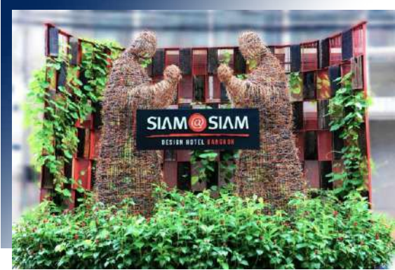
Siam@Siam Design Hotel Bangkok (Khemvadee Paopanlerd)

體驗殖民時期改造街屋、入住曼谷最高地標 突顯在地傳統特色、新潮超現代化設計，混合在曼谷的酒店設計中