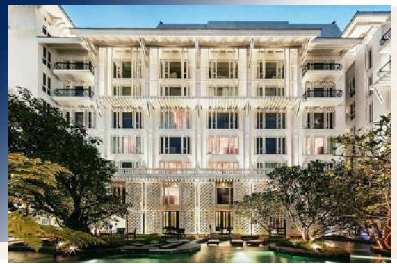
Sala Ayutthaya (Onion)

雪白外觀搭配室內宮廷風設計、鮮豔明亮色彩及大廳大片落地玻璃帷幕，讓綠意盎然的花園景致完全展現眼前，加上戶外宛如小島的花園，在如傳統皇家氛圍上也營造出迷你熱帶海島風情。