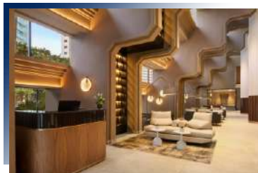
卡薩布蘭加市中心五星飯店