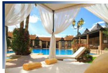
享受宛如明星待遇的服務

位在馬拉喀什最繁華的大道上，兩旁商店林立，方便旅遊動線之餘，也可享受奢侈的閒情逸致，飯店新穎設計的建築與一旁紅土建築形成強烈對比。