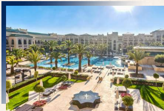
摩洛哥最奢華飯店