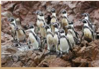
洪保企鵝 Humboldt Penguin

洪保企鵝(Humboldt Penguin)小企鵝是終生不見雪的企鵝，主要在秘魯和智利繁殖，體型較小，像一隻會站立的小鴨子，在海中是游泳高手，不過一上岸就顯得相當笨拙了！偏偏卻喜歡上岸，不時還會見到牠們向天高聲呼叫，模樣煞是可愛！