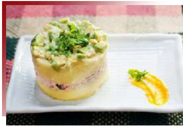
Causa de Atún