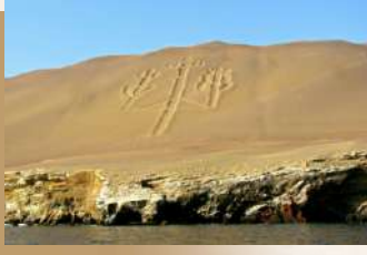
燭臺 Paracas Candelabra

海灣附近的巨大三叉戟圖案▲燭台，其形狀像蠟燭台，也有些仙人掌樹，看上去就像外星人著陸的航道。考古學家推測這地畫可能是西元850至1350年之間的作品，和納斯卡線一樣，大家想知道究竟是誰畫的？目的為何？然而至今仍是一個謎。