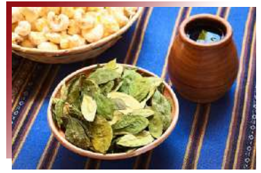
Mate de Coca

將馬鈴薯壓成泥狀，混以秘魯黃辣椒醬調味，並製作成似漢堡麵包般上下兩層，內餡則以鮭魚拌入美乃滋，擺盤前再運用水煮蛋切片、酪梨等，並撒上香菜加以妝點，最後再淋上些許檸檬汁，以達畫龍點睛的完美境界，層層堆疊，-秘魯人就像創作藝術般對待美食佳餚。