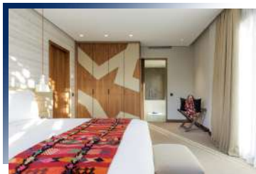
馬拉喀什精選五星飯店兩晚

萬豪集團經營之國際品牌，擁有得天獨厚的地理位置，步行即可抵達老城區及購物中心，讓您不僅住的舒適，更能玩得輕鬆！