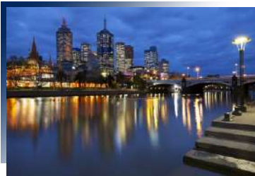
Pan Pacific Hotel 5*或同級 墨爾本市區五星飯店

安排墨爾本市區五星飯店入住1晚，方便您夜晚自由前往餐館、咖啡廳林立，美麗的亞拉河畔漫步參觀，感受澳洲藝文之都，國際大都會的日夜氛圍。