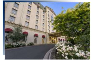
Grand Chancellor 4*或同級 朗瑟斯頓入住一晚

安排連泊三晚，以閒適的步調走訪充滿歷史風情的塔斯首府荷巴特及周遭景點，探索國家公園、看神秘的監獄遺址、登高眺望市區全景等，每一天每一刻都精彩。