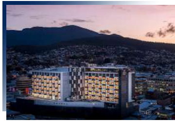
Crowne Plaza 4*或同級 首府荷巴特三連泊

安排墨爾本市區五星飯店入住1晚，方便您夜晚自由前往餐館、咖啡廳林立，美麗的亞拉河畔漫步參觀，感受澳洲藝文之都，國際大都會的日夜氛圍。