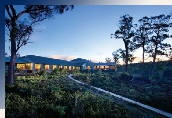
Cradle Mountain Hotel 4*