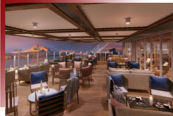
Sky Bar (Deck 9)