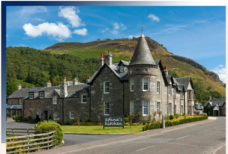
Kimpton Charlotte Square Hotel ★★★★★

維多利亞風格古宅經兩年時間、耗資數百萬英鎊翻新，出自獲獎無數的設計團隊之手於 2017 重新開業，重現過往的典雅愜意。僅有 32 室的房間皆擁有蘇格蘭高地靜謐景致，是令人舒心坦然的休憩之所。