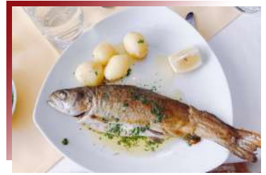
絕鮮食材的味蕾衝擊 湖區鮮美鱒

位於德法邊境的亞爾薩斯區，百餘年間被更迭政權統治數次，因此無論建築風格、文化，甚至飲食，皆發展出獨特性。鴨子於法菜中有多種變化，無論是油封鴨或是煎鴨胸，在法國小鎮，以浪漫氛圍相隨，一嚐箇中滋味！