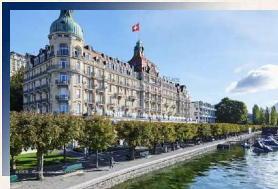
Mandarin Oriental Palace Luzern ★★★★★