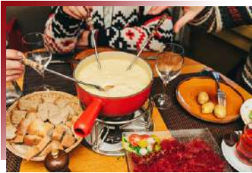
瑞士必嚐 瑞士風味火鍋

豬腳如今可說是德國代表菜色。南部多以燒烤、煙燻等方式料理，北部則採水煮。配菜則當屬經典德國酸菜。來到德國當然要豪啃經典豬腳，搭配巴伐利亞啤酒，暢快朵頤一番。