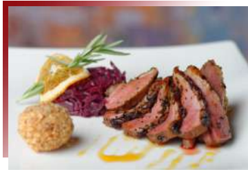
舌尖上的鴨子 道地法式鴨

來到起司火鍋的發源地瑞士品嚐道地風味！有別於中式火鍋，在瑞士，通常用數種阿爾卑斯山出產的起司混合，入酒調味，加熱後濃郁的起司火鍋上桌啦，可以搭配麵包和蔬菜沾著吃，甚是滿足。