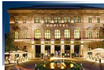
Sofitel Munich Bayerpost ★★★★★

精選史特拉斯堡市中心五星飯店，融合傳統亞爾薩斯元素與現代裝飾的設計風格，周邊圍繞著主要景點，讓您在亞爾薩斯首府之旅更加輕鬆悠閒。