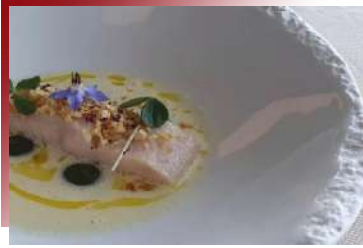
米其林一星。誠心款待 米其林星級料理

用心嚴選在地經典美食，擺脫一般傳統旅行團對於中歐餐食的刻板安排，為的就是豐富您的舌尖味蕾，不僅吃得道地，更要吃進驚喜！