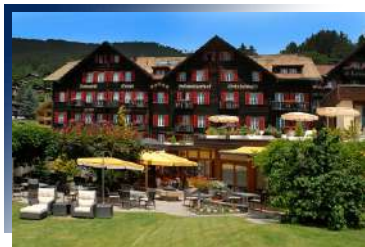
Romantic Hotel Schweizerhof Grindelwald ★★★★★