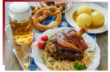
德國必啃 德國豬腳

全歐洲每到聖誕節期間，不僅以其閃爍的燈飾和節日氣氛聞名，還有琳琅滿目的美食在聖誕市集等著你來品嚐，給大家推薦必吃美食，熱紅酒、咕咕霍夫、國王餅、扭結麵包、薑餅、肉桂、糖炒杏仁、烤香腸、聖誕蛋糕、聖誕布丁，千萬不能錯過喔！！