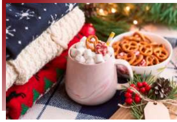
聖誕市集美味佳餚 聖誕市集・必吃美食

依循四時更迭的菜單，由主廚挑選當季食材，以兼具細膩與驚喜的料理手法，端呈無與倫比的精彩美饌。