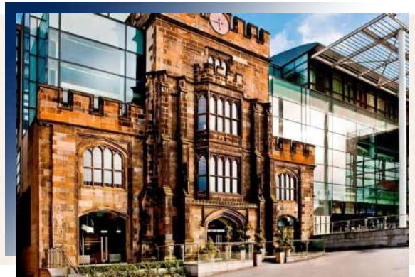
The Fitzwilliam Hotel ★★★★★

以大面玻璃和古老教堂為立面的組合既新奇又大膽，呼應著原本建築的歷史同是嶄露大膽的設計風格。房間內的色彩卻顯得穩重又簡潔，深的木頭色搭配著落地窗美景，絕對是愛丁堡市區中的都市綠洲。