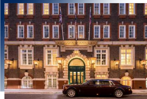
Great Scotland Yard Hotel ★★★★★