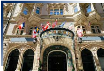
Paris Hotel Prague★★★★★