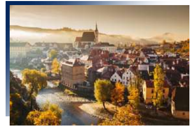
Hotel Grand★★★★ 或同級

座落捷克波希米亞、一座浪漫的英式公園所擁抱的奢華城堡旅館Chateau Herálec，牆上的每塊石頭說著800年前的故事、而住宿體驗卻完全能滿足21世紀的需求。