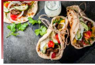
物美價廉，希臘必吃小吃美食 烤肉卷餅 Gyros Pita

米其林餐廳用享享受的是主廚白袍下的藝術家靈魂創作。除了能滿足味蕾的高標要求，每道菜都是一幅精彩畫作。餐廳本身擁有自己的農場，大部分的蔬果都來自於此，從農場到餐桌的距離非常近，如同他的餐廳名稱所代表的:Soil，蔬菜在此成為最亮眼的主人公。