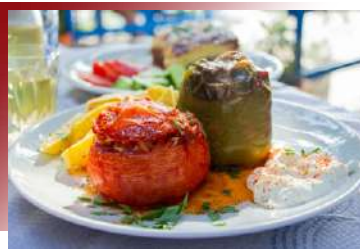
希臘小酒館和家庭中最受歡迎的菜肴

在家庭聚會中，主婦媽媽們招待客人必做的菜，它是將肉末、馬鈴薯、茄子、番茄和起司等食材層層疊加，在每一層上添加乾香菜、小茴香、胡椒、肉桂、姜和鹽等調味品，再將醋和一小撮藏紅花與少量水混合。