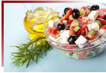
希臘人餐餐必備品

蔬菜（通常是番茄、椒類）烤過後塞入米飯、碎牛肉或豬肉、蔬菜和調味料，再烤到軟的傳統料理。