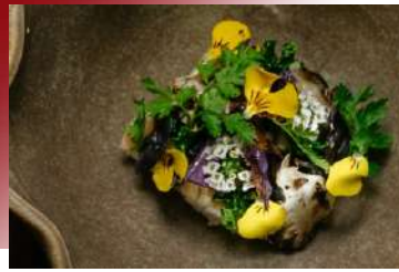
Michelin-Star Feast 米其林一星饗宴

米其林餐廳用享享受的是主廚白袍下的藝術家靈魂創作。除了能滿足味蕾的高標要求，每道菜都是一幅精彩畫作。餐廳本身擁有自己的農場，大部分的蔬果都來自於此，從農場到餐桌的距離非常近，如同他的餐廳名稱所代表的:Soil，蔬菜在此成為最亮眼的主人公。