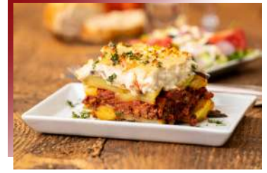
希臘媽媽的家常手路菜 穆薩卡Moussaka

卷餅裡面通常是包豬肉或牛肉，也有羊肉和雞肉的，甚至有些商家變化改成魚、海鮮甚至是素食。烤肉卷餅在希臘非常受歡迎，是希臘必吃的美食。