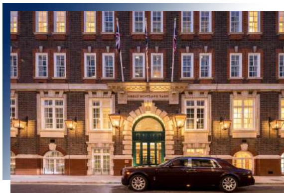
Great Scotland Yard Hotel ★★★★★