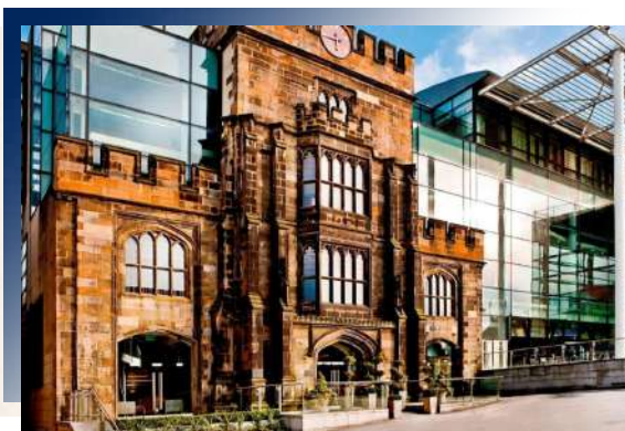
The Fitzwilliam Hotel ★★★★★

以大面玻璃和古老教堂為立面的組合既新奇又大膽，呼應著原本建築的歷史同是嶄露大膽的設計風格。房間內的色彩卻顯得穩重又簡潔，深的木頭色搭配著落地窗美景，絕對是愛丁堡市區中的都市綠洲。