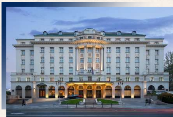
Hotel Esplanade Zagreb 5★ 或 Hotel Le Premier 5★ 或同級

精選各景區優質飯店，讓您盡情享受豪華的裝潢，舒適的床鋪，卸去一天的疲累，欣喜入夢。