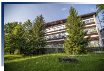
Hotel Jezero Plitvice 3★ 或 Grabovac Hotel 3★ 或同級 獨占16湖的靜好與美麗

歐帕提亞的度假飯店，映入眼簾的盡是令人驚豔的絕佳景色，您可漫步於海濱，盡享優雅浪漫的貴族氣氛。