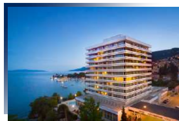
Hotel Ambassador Opatija 5★ 或 Hilton Rijeka Costabella 5★ 或同級