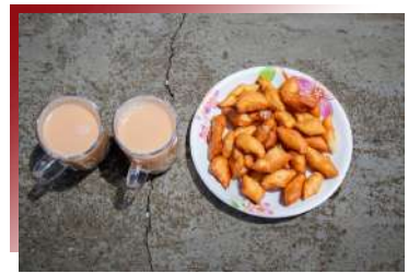
特色飲食，不容錯過 不丹傳統酥油茶

這是辣椒和起司。ema（辣椒），datshi（起司）每天在不丹時不時不但可以吃到，而且還可能每餐都吃。辣椒可以是新鮮的綠色辣椒或乾紅辣椒，沿著長方形切片，用當地不丹起司和大量奶油一起煮。