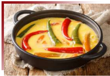
Ema datshi 不丹辣椒起司

因為不丹不殺生，所有的肉類都從鄰國進口，抵達雷龍之國，仍然可以嚐到肉類的料理。鮮明的薑味是真正托出這道菜的精華所在，口感吃起來相當溫和。