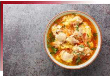
Jasha maru 不丹燉雞肉

因為不丹不殺生，所有的肉類都從鄰國進口，抵達雷龍之國，仍然可以嚐到肉類的料理。鮮明的薑味是真正托出這道菜的精華所在，口感吃起來相當溫和。