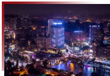
俯瞰開羅天際線夜景 開羅高樓層景觀晚餐

三天兩夜的尼羅河遊輪除了連泊的舒適性，便於可以用更多的時間參觀景點，船上的餐廳將以提供自助餐為主，讓您免於等待可以更加妥善的利用時間，不浪費一分一毫。