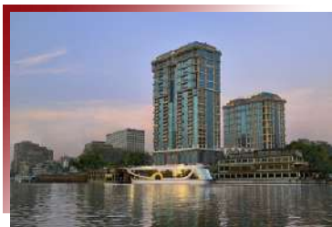
在甲板上飽覽開羅與尼羅河風光的Zoé餐廳