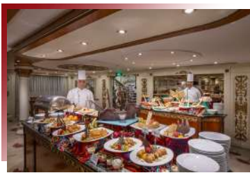
體驗別樹一幟的用餐趣 遊輪自助饗宴

停泊於四季飯店碼頭的First Nile遊船，上層甲板是景觀餐廳Zoé。Zoé得天獨厚的位置，讓遊客得以大啖兼具地中海與中東風味的精緻料理，同時將開羅市區與尼羅河美景盡收眼底，享受國際級的用餐體驗。