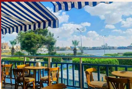
蒂姆薩湖畔的燈光熠熠