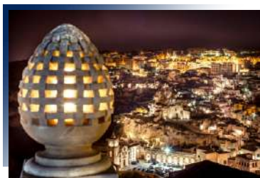
馬特拉特色洞穴旅館體驗 洞穴裡的奇幻之旅

位於馬特拉的古城區，在日落與清晨可一覽馬特拉波瀾壯闊之美。飯店本身保留著Sassi經典的穹頂設計，彷彿帶旅人回到舊時光之中，迷般的巷弄、石頭屋等是古老的智慧，而更新過的現代設施則是讓住宿品質大大提升。