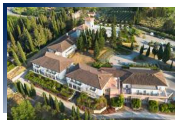
Cappuccina Country Resort ★★★★★或同等級

坐落於佛羅倫斯藝術與歷史核心，客房與套房以波波里花園繁花和新聖母百花大教堂壁畫為靈感，色彩融入植物與藝術元素，鄰近火車站，烏菲茲美術館及聖母百花大教堂步行可達。