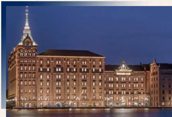
Hilton Molino Stucky ★★★★★或同等級 水都威尼斯的優雅

精選城市核心地段入住，白日感受繁華人文，夜晚沉醉璀璨燈火，體驗越夜越美麗的都會魅力。