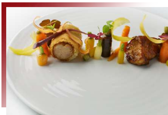
Homard Bleu de Bretagne 布列塔尼藍龍蝦

全球頂尖大廚的尊寵、龍蝦中之極品！若松露、肝、魚子醬是法國料理的狀元、榜眼和探花，那麼名列第四應是此蝦了。高級法式餐廳都不敢不放進菜單的昂貴食材！在法國，此蝦與加拿大龍蝦（波士頓龍蝦）價格是天壤之別啊！