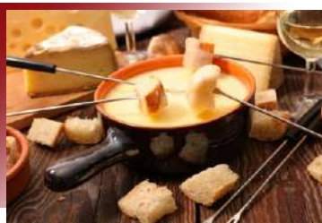
芝香濃郁，暖心暖胃的必嚐美味 瑞士風味火鍋

位於德法邊境的亞爾薩斯區，百餘年間被更迭政權統治數次，因此無論建築風格、文化，甚至飲食，皆發展出獨特性。鴨子於法菜中有多種變化，無論是油封鴨或是煎鴨胸，在法國小鎮，以浪漫氛圍相隨，一嚐箇中滋味！