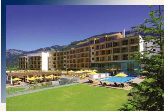
Kempinski Hotel Das Tirol★★★★★

鄰近Bota山城基茨比厄爾(Kitzbühel)，藏身萬綠之端。自然木質系的溫馨感，結合Kempinski集團一貫地低調奢華，大器典雅，無不展露於此。精巧結合戶外元素，予您絕加放鬆的住宿享受。