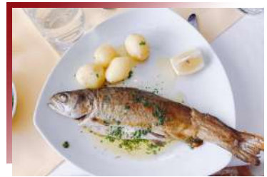
絕鮮食材的味蕾衝擊 湖區鮮美鱒

策馬特特有的黑面綿羊，有多可愛就有多好吃~無腥羶又富含鮮美肉汁的羊排搭配道地醬汁，就是策馬特最知名的美食。