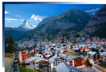
山王初現，天下無山

安排少女峰山城停留兩晚，雪山群的壯闊與清新的空氣，帶您深刻體驗與感受瑞士鄉間小鎮的寧靜與凝靜，更是方便隔日搭乘少女峰景觀列車的最佳住宿點。