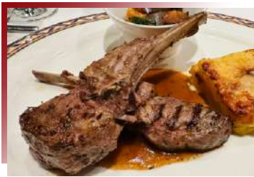
瓦萊州特產 雪域裡的珍稀饗宴 策馬特黑面羊

來到起司火鍋的發源地瑞士，品嚐道地風味！有別於中式火鍋，在瑞士，通常用數種阿爾卑斯山出產的起司混合，入酒調味，加熱後濃郁的起司火鍋上桌啦，可以搭配麵包和蔬菜沾著吃，甚是滿足。