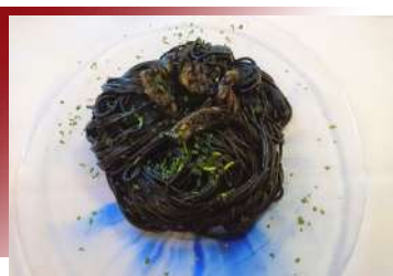
Spaghetti al nero di seppia

一道義大利經典美饌，以彈牙的義大利麵搭配新鮮龍蝦烹製，佐以番茄與香草調味。醬汁鮮美濃郁，完美融合海味與麵香，每一口都散發地中海的熱情風味。