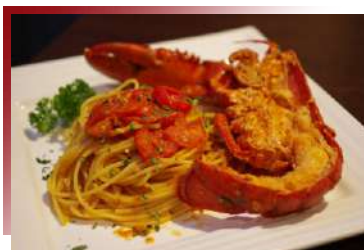
Spaghetti con Astice