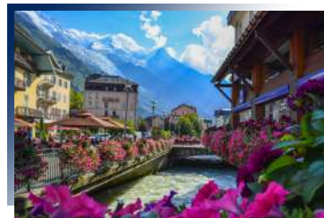
Lykke Hotel & Spa Chamonix ★★★★★ 或同級

盧森建於1178年，是座兼容古典與浪漫的城市，不僅是瑞士的心臟，更擁有歐洲蜜月之鄉的美名。老城坐擁壯觀的阿爾卑斯山脈和湖泊美景，每一處都讓人無法放下手中的相機。