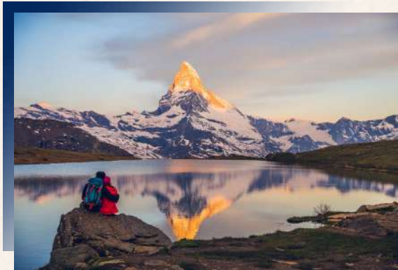
Hotel Bergwelt Grindelwald ★★★★★ 或同級

精選各景區優質飯店，讓您盡情享受最便利的交通位置， 舒適的床鋪，卸去一天的疲累，欣喜入夢。