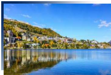
Hotel Monopol ★★★★★ 或同級