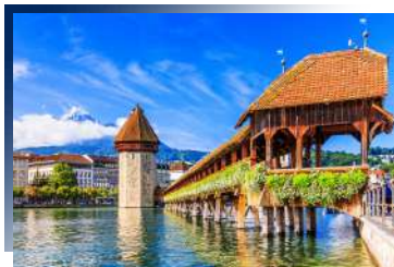
Renaissance Lucerne Hotel ★★★★★ 或同級

聖莫里茲是海拔1856公尺的山城，也是瑞士最冷的城市之一，但是全年陽光充沛，冬季為滑雪勝地而夏季則為度假聖地。瑞士人形容它擁有「香檳」般的美好天氣！為您安排首站住宿由此開始，行程漸往高處山峰攀頂，健行者的圓夢起點。