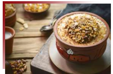
埃及傳統特色甜點

第一位以阿拉伯文學，獲頒諾貝爾文學獎的得主-Naguib Mahfouz，生前最喜歡的餐廳。餐廳經營逾百年，在這裡可以品嚐到埃及經典，又令人充滿驚喜的美味佳餚，同時感受瀰漫在空氣中的文學氣息。