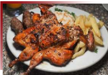
埃及必吃特色料理