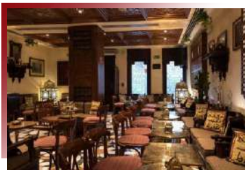
藏身市集的名家料理

將處理後的鴿子用傳統木炭慢慢燒烤，帶點橘色，加上微焦的香氣，再刷上甜香料雙重混合，是最受歡迎的埃及傳統菜餚。埃及人說鴿子是男性壯陽神藥，也是婦女產後補品，如果不是有錢人，一般民眾平常可是很難吃到呢！