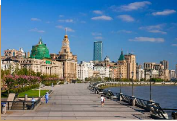
華爾道夫附近的外灘