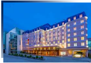
Sheraton Grand Salzburg ★★★★★ 或同級

哈斯塔特的美，不該讓您只是到此一遊；特別安排入住哈斯塔特小鎮上，讓您放下行囊、停下腳步，細細品味絕美小鎮的迷人魅力，感受人間仙境之中的日與夜。