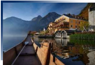
Seehotel Grüner Baum ★★★★ 或同級