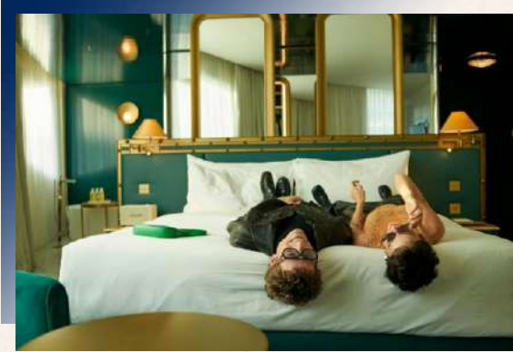
Hotel Weisses Rossl am Wolfgangsee ★★★★或同級